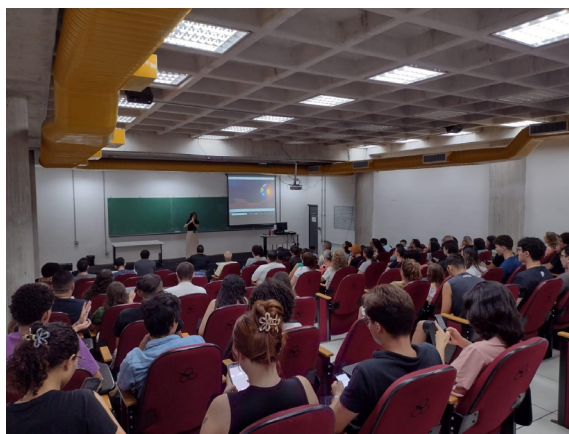
Figura 3 - Registros dos eventos VI Congresso UFABC e UFABC para Todos 2024